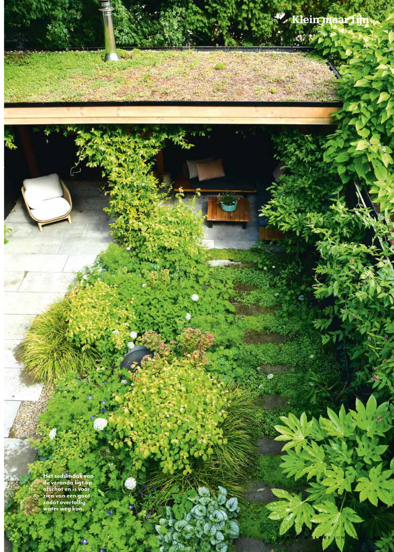
Het sedumdak van de veranda ligt op afschot en is voorzien van een goot zodat overtollig water weg kan.

Taletta volgde een deeltijdvakopleiding bij de OntwerpAcademie en werd tuinontwerpster. Overweeg jij ook een groene carrière of ben je op zoek naar meer verdieping in het groen? Leer tuinen duurzaam ontwerpen en beplanten bij de OntwerpAcademie. Maak de wereld groener en gezonder en wordt natuurinclusief tuinontwerper of beplantingsspecialist. www.ontwerpacademie.nl