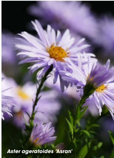
Aster ageratoides 'Asran'