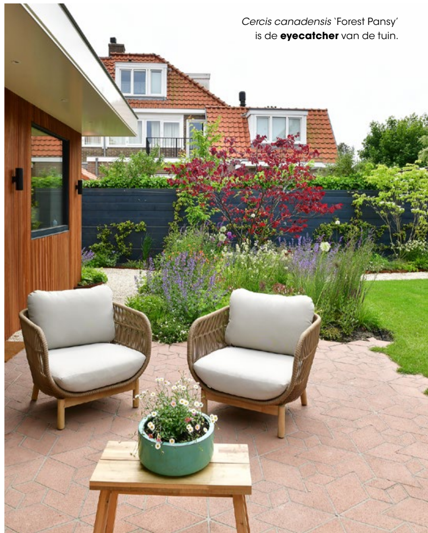
Cercis canadensis 'Forest Pansy' is de eyecatcher van de tuin.